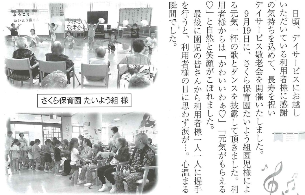
さくら保育園 たいよう組様

日頃、デイサービスにお越しただいて利用者に感謝の気持ちを含めて、長寿を祝い、デイサービス敬老会を開催いたしました。 9月19日に、さくら保育園たいよう組園児様による元気一杯の歌とダンスを披露して頂きました。利用者様からは「かわいいわあ」「元気がもらえる」と自然と笑顔がこぼれました。 最後に園児の皆さんから利用者様一人一人に握手を行うと、利用者様の目に思わず涙が…。心温まる瞬間でした。