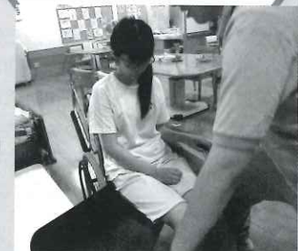
スライディングボードを使った移乗の練習風景