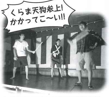
くらま天狗参上! かかってこーい!!

今回「あの時代を懐かしむ」のテーマの下、利用者様の貼り絵「お台所」「昔の遊び」の大作や、タイムスリップしそうな懐かしい道具、写真などを展示。ステージ発表では、個性豊かな職員の出し物「ファッションショー&寸劇」や「フラダンス」が披露され、会場内がたくさんの笑いに包まれました。