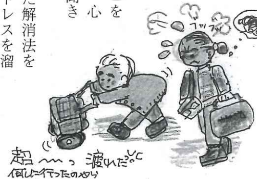
超疲れたイライラしたのやり

この介護者さんは夜眠る前に、その日にあったことを手帳に書き込んでいます。イラストにきれいな色を塗っていると、心が落ち着くと聞きました。自分に合った解消法を見つけて、ストレスを溜めないような介護をしましょう。