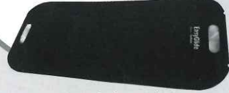
スライディングボード