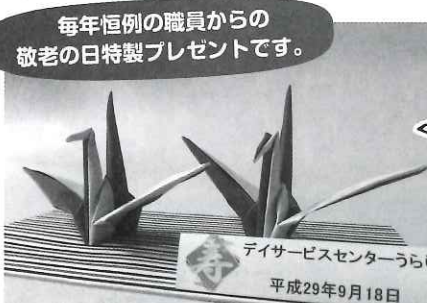
毎年恒例の職員からの敬老の日特製プレゼントです。

二日目は、鳳泉会の皆様による踊りを見せていただきました。両日も、利用者の皆様はとて嬉しそうに見え、楽しんでおられたように思います。