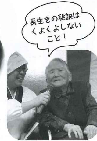
長生きの秘訣はくよくよしないこと!