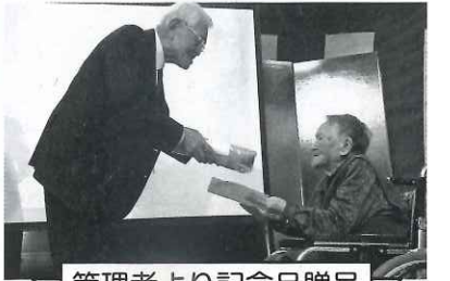
管理者より記念品贈呈