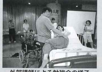
外部講師による勉強会の様子