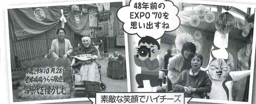
48年前のEXPO '70を思い出すね